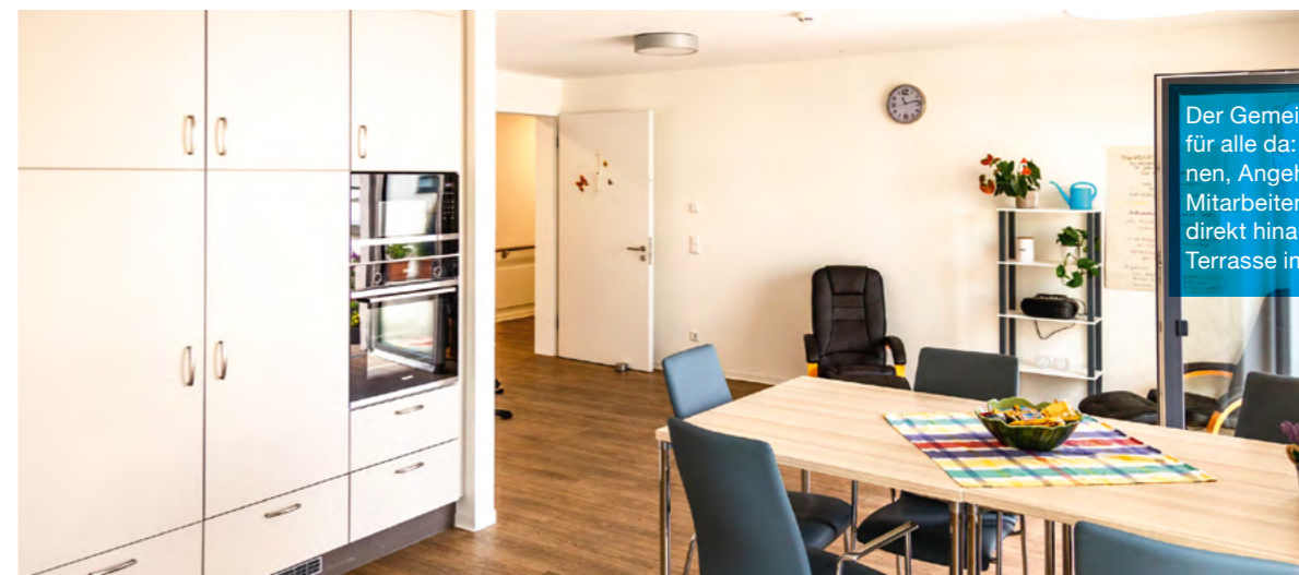
Der Gemeinschaftsraum ist für alle da: Bewohner*innen, Angehörige und Mitarbeitende. Er führt direkt hinaus auf die Terrasse im ersten Stock.

qualifiziert haben. Außerdem sorgen wir dafür, dass Physiotherapeuten, Logopäden, Ergotherapeuten und Hausärzte zu Ihnen ins Haus kommen.