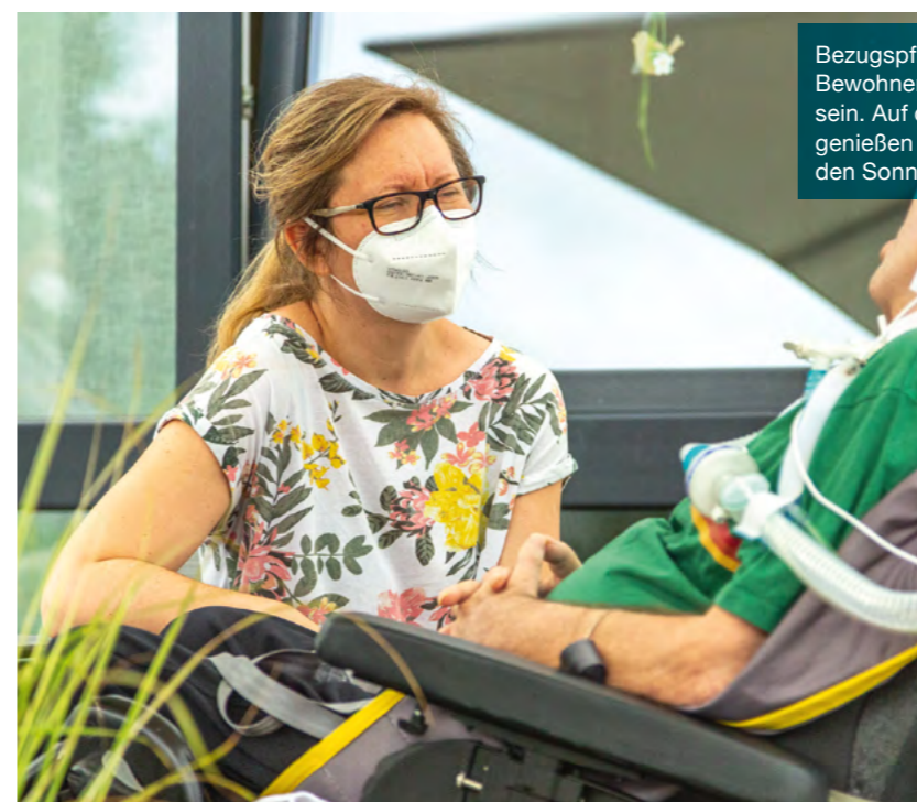
Bezugspflege bedeutet, den Bewohner*innen nah zu sein. Auf der Außenterrasse genießen auch Bettlägerige den Sonnenschein.

Sie schlafen gern länger und schauen bis spät in die Nacht fern? Das ist völlig in Ordnung. Wir passen uns Ihrem Rhythmus an. Gern begleiten wir Sie auch bei Einkäufen oder kleinen Ausflügen, zum Beispiel in den Zoo oder zu einer Geburtstagsfeier.