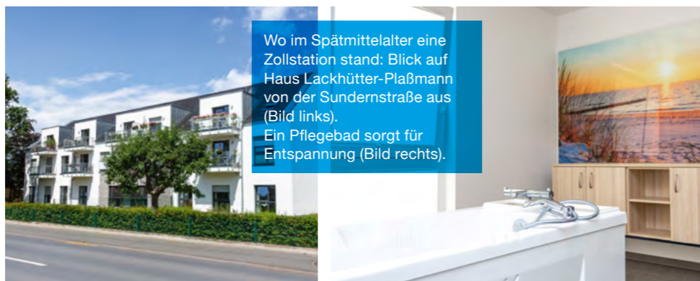
Wo im Spätmittelalter eine Zollstation stand: Blick auf Haus Lackhütter-Platzmann von der Sundernstraße aus (Bild links). Ein Pflegebad sorgt für Entspannung (Bild rechts).

Das Team: qualifiziert und gut eingespielt Sechs Plätze stehen für die außerklinische Intensivversorgung zur Verfügung. Unser qualifiziertes und gut eingespieltes Team sorgt rund um die Uhr für die uns anvertrauten Menschen. Das heißt: Die intensivpflegerische Versorgung im Drei-Schicht-System ist immer gewährleistet. Unsere Pflegefachkräfte sind sehr erfahren in der Betreuung von Beatmungspatienten: Wer hier selbstständig und eigenverantwortlich an einem Beatmungsgerät arbeitet, muss eine dreijährige Ausbildung vorweisen können und sich in Fortbildungen zusätzlich